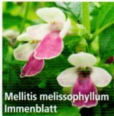
Mellitis melissophyllum Immenblatt