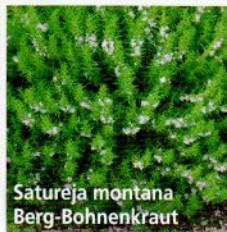
Satureja montana Berg-Bohnenkraut