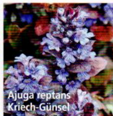
Ajuga reptans Kriech-Günsel