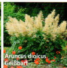
Aruncus dioicus Geißbart