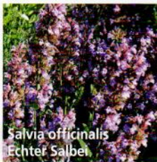
Salvia officinalis Echter Salbei