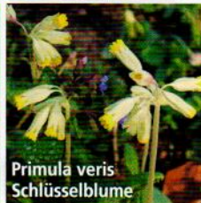
Primula veris Schlüsselblume