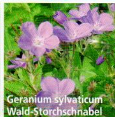
Geranium sylvaticum Wald-Storchschnabel