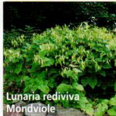
Lunaria rediviva Mondviole