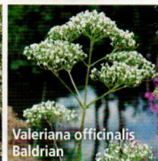
Valeriana officinalis Baldrian