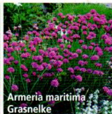
Armeria maritima Grasnelke