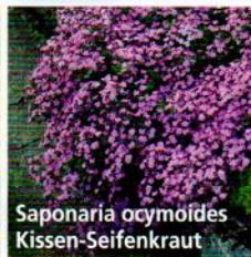
Saponaria ocymoides Kissen-Seifenkraut