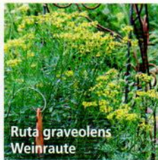
Ruta graveolens Weinraute