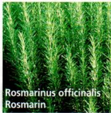
Rosmarinus officinalis Rosmarin