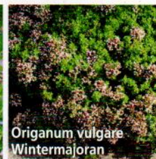
Origanum vulgare Wintermajoran