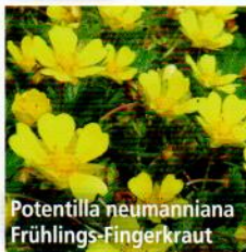
Potentilla neumanniana Frühlings-Fingerkraut