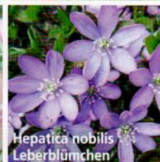
Hepatica nobilis Leberblümchen