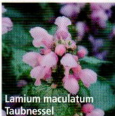
Lamium maculatum Taubnessel