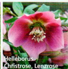
Helleborus Christrose, Lenzrose