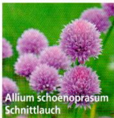
Allium schoenoprasum Schnittlauch

Sie sind nicht nur in der Küche beliebt – auch eine Vielzahl von Bienen, Hummeln und Schmetterlingen tummeln sich um den reichen Blütenflor von Gewürz- und Heilkräutern! Hier nur eine kleine Auswahl der beliebtesten Pflanzen: